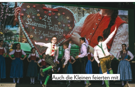
Auch die Kleinen feierten mit.