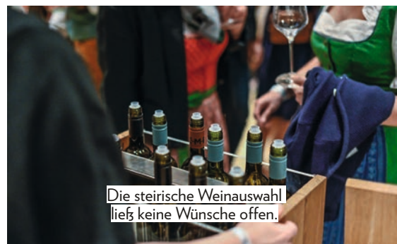
Die steirische Weinauswahl ließ keine Wünsche offen.