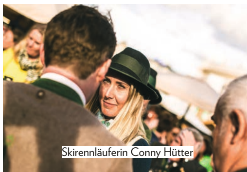
Skirennläuferin Conny Hütter