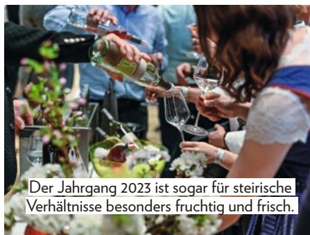
Der Jahrgang 2023 ist sogar für steirische Verhältnisse besonders fruchtig und frisch.