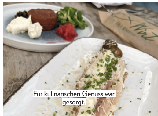
Für kulinarischen Genuss war gesorgt.