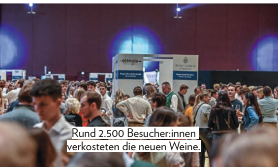
Rund 2.500 Besucher:innen verkosteten die neuen Weine.