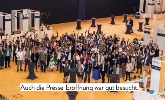
Auch die Presse-Eröffnung war gut besucht.