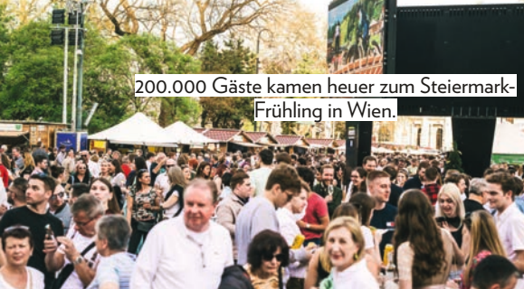
200.000 Gäste kamen heuer zum Steiermark-Frühling in Wien.