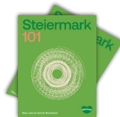
Magazin Steiermark 101