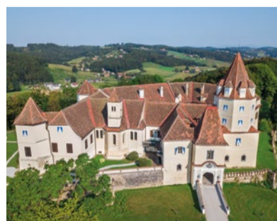
© Bardeau GmbH | Fotograf Franz Suppan