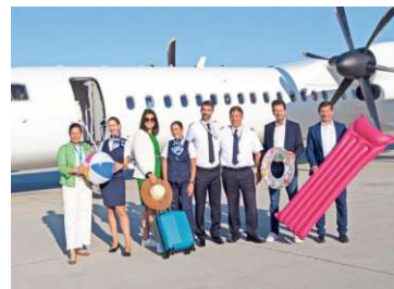
Ab nach Mykonos: Ein Bild vom Erstflug am Montag