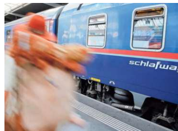
Nachtzug: Die Koralmbahn bringt Neuerungen