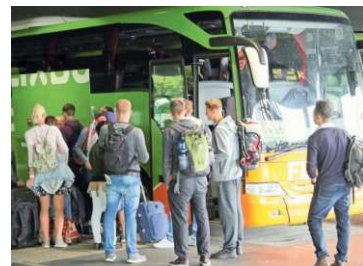
Nur einmal Umsteigen nach London: Mit FlixBus