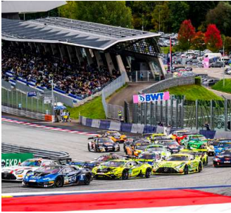
Die DTM gastiert Mitte September am Red Bull Ring. MICHAEL JURTIN RED BULL RING