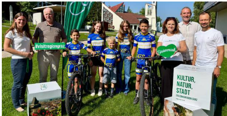
Rund um Laßnitzhöhe laden die Radwege zum Biken und Genießen ein. Das freut auch die Kids vom Radclub Laßnitzhöhe.