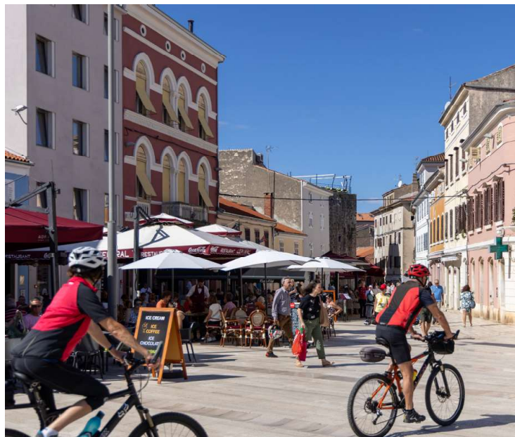
Auch Porec kann man mit dem Rad erkunden. Generell ist Istrien mit seinem gut ausgebauten Radwegenetz ein Paradies für Radurlauber.

Und das Beste: Die Radwege sind für alle Radfahrer geeignet. Egal ob Familien mit kleinen Kindern, Senioren oder sportliche Radprofis, die keine Herausforderung scheuen, in Istrien ist für jedes Alter und jeden Fitnessgrad garantiert das Richtige dabei.