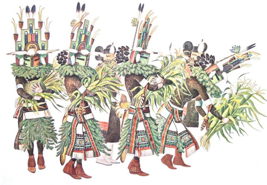
HOPi Homedance – Niman Kachinas / Grafik: © Fred Kabotie